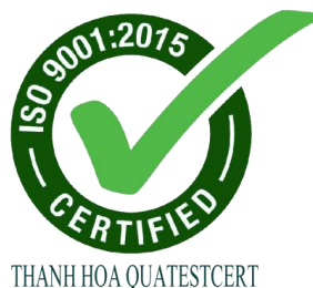
Hình 03. Hình dạng của dấu sản phẩm hợp chuẩn

Dấu hiệu chứng nhận hợp chuẩn sản phẩm được thể hiện như Hình 03: